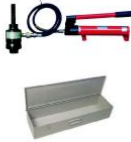
HPC-E Hidrolik El Punch Takım Seti