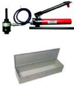
HPC-A Hidrolik Ayak Punch Takım Seti