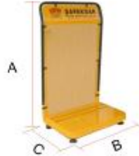
STD-03 Şafaksan Stand